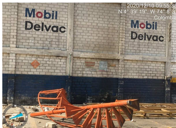
Fotografía 3. Pared impactada con aceite usado