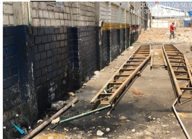
Fotografía 4. Pared y placa en concreto con mancha de aceite usado