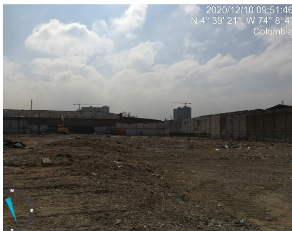
Fotografía 1. Área total del predio desmantelada

A continuación se ilustran el registro fotográfico del estado actual de los predios.