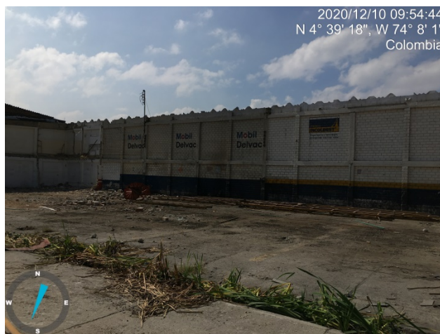
Fotografía 2. Área antigua zona de almacenamiento de aceite usado, suelo en concreto de All Cargo